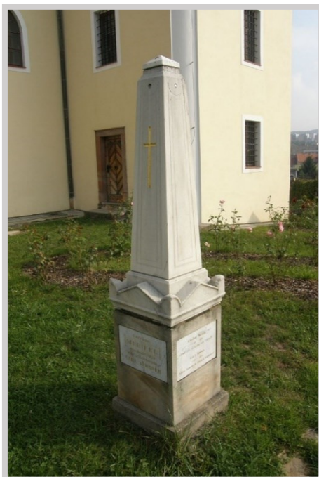
Obr. 66 Památník u kostela sv. Martina