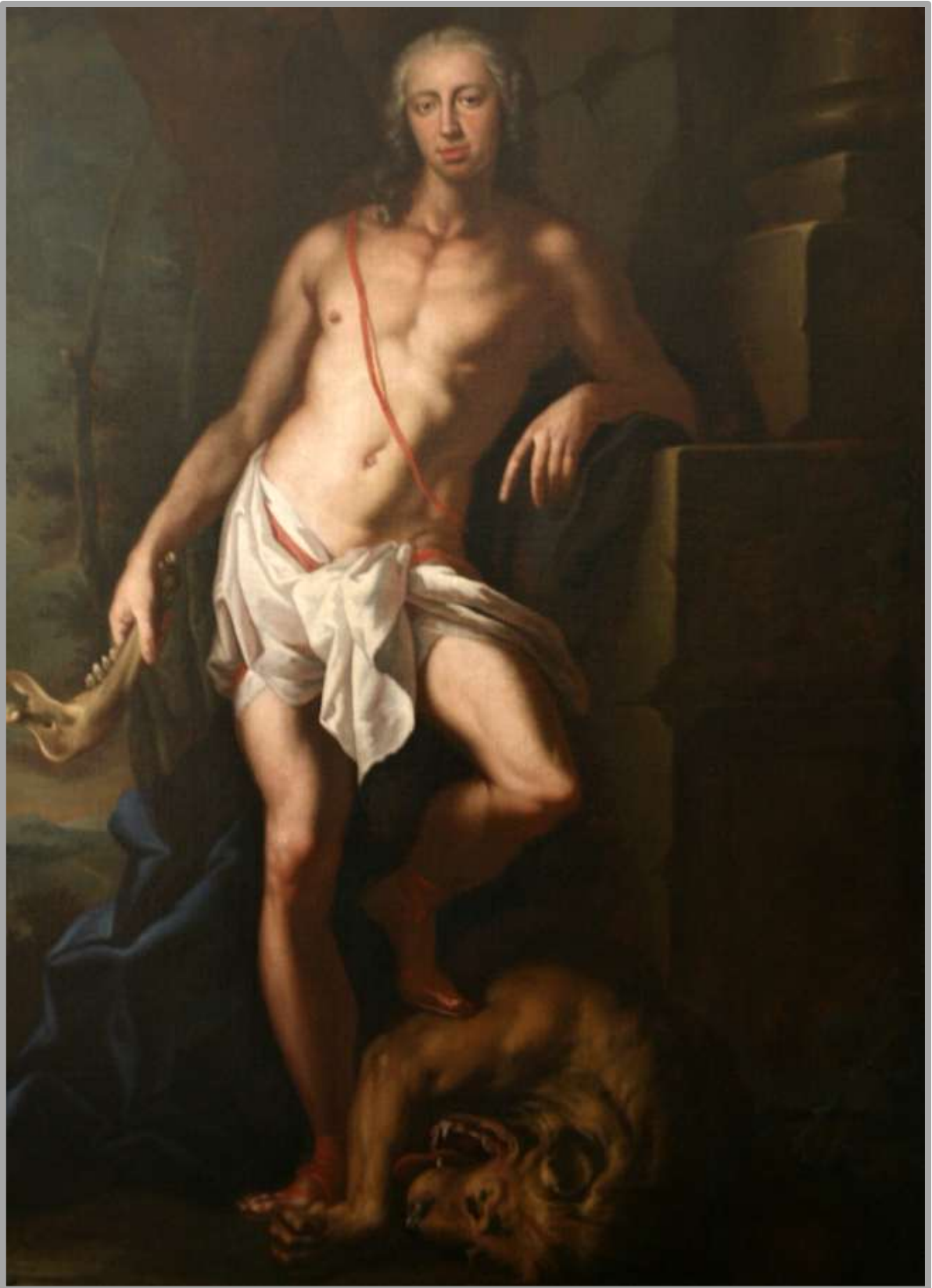
Neznámý autor: Leopold Klement Otislav z Kopenic (+1742)