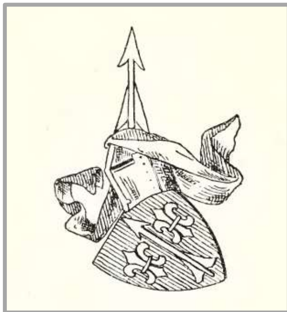
Erb Otislavů z Kopenic